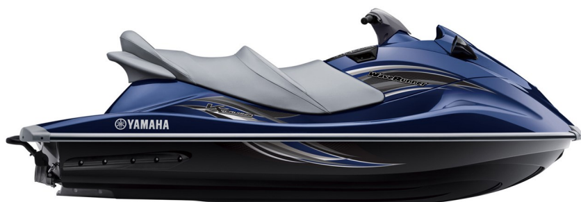
Yacht Blue Metallic