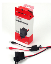
YEC Battery Charger Built-in Panel Plug