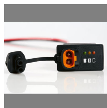
YEC Indicator Panel 150