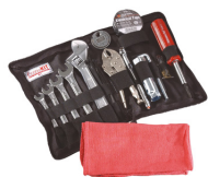
Metric Tool Kit