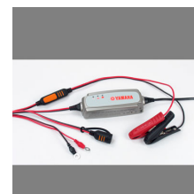
YEC-8 Battery Charger

For all YFM700R / SE accessories go to the website, or check your local dealer