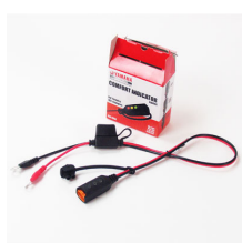
YEC Battery Charger Indicator